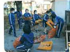
▲落ち葉拾いボランティア