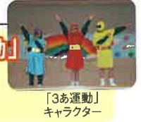
「3あ運動」キャラクター