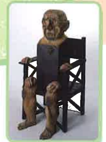
マリソール(ピカソ) 1981年